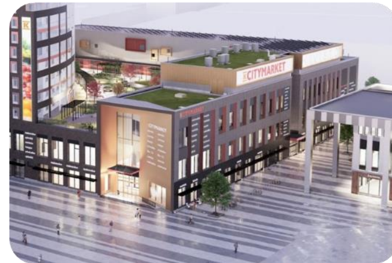
K-Citymarket, Kivistö, Vantaa